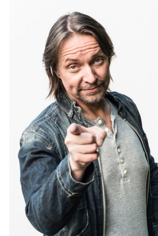
Der Obel (Andreas „Obel“ Obering) „Der Hammer unter den Comedians“